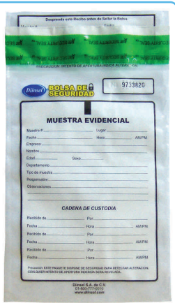
Bolsa de Custodia

DrugCheck® está aprobado por la Food and Drug Administration de Estados Unidos (FDA) y la Secretaría de Salud de México (SSA). Este producto es único por su método de detección. Dado que las tiras de detección están aseguradas en el interior del frasco hermético, las cuales trabajan por medio de gravedad, DrugCheck® elimina la necesidad de manejar muestras de orina. Menos manejo significa menos riesgo de contaminación o error y MENOS TIEMPO. Sólo deposite la orina en el frasco y lea los resultados. No requiere llaves ni manipulaciones en el frasco. Cuenta con una tapa de rosca la cual la hace ser muy segura, ya que las tapas de presión suelen ajustarse de manera incorrecta y esto provoca accidentes al destapar.